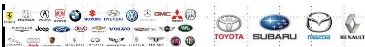
Abbildung 4 Übersicht Automarken mit Navigationssystemen von "Here" und "Tomtom"

Bitte beachten Sie, dass ein Update der Daten im Auto abhängig von einer Internetverbindung ist. Das heißt, ohne Verbindung zum Internet, werden die Daten in älteren Modellen nicht automatisch aktualisiert.