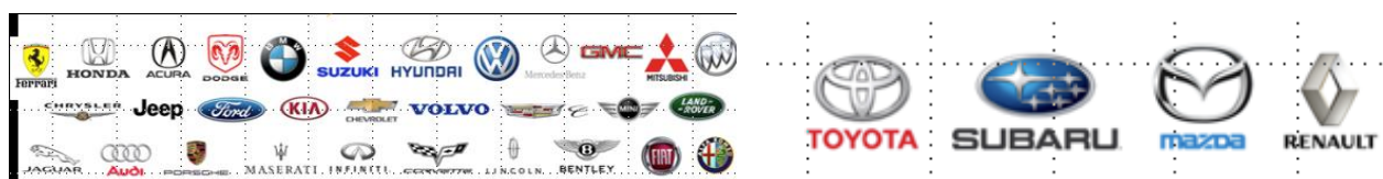
Abbildung 4 Übersicht Automarken mit Navigationssystemen von "Here" und "Tomtom"

Bitte beachten Sie, dass ein Update der Daten im Auto abhängig von einer Internetverbindung ist. Das heißt, ohne Verbindung zum Internet, werden die Daten in älteren Modellen nicht automatisch aktualisiert.