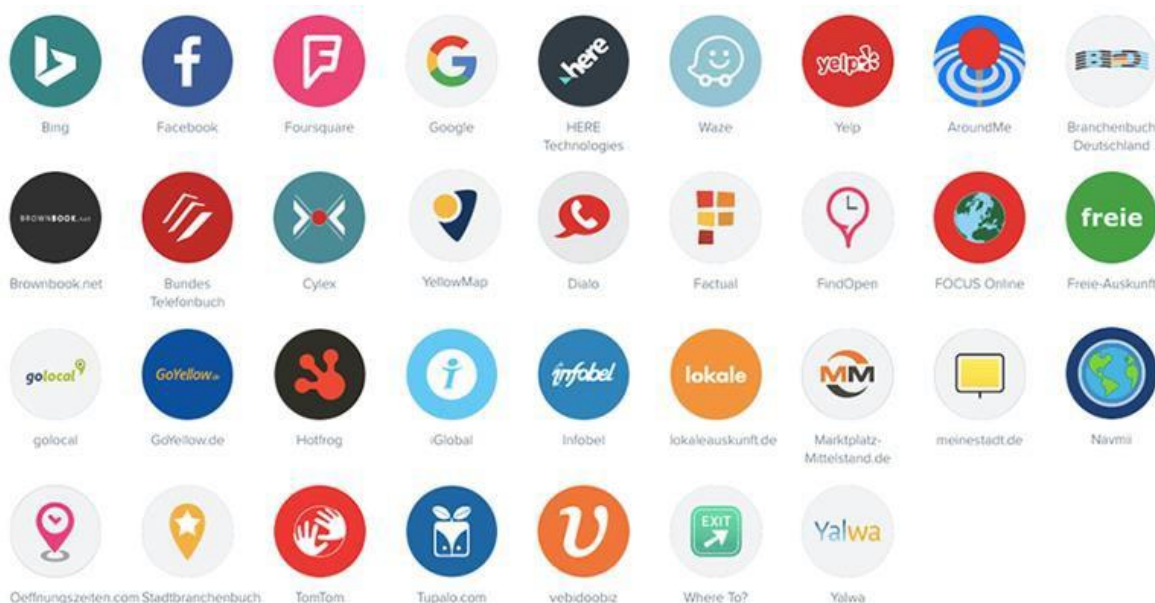
Abbildung 3 Übersicht der Verzeichnisse und Apps

Über Schnittstellen zu den einzelnen Verzeichnissen (Publisher-Netzwerken) werden Ihre Daten automatisch eingespielt. Dabei gibt es zwei prominente Ausnahmen, die eine besondere Zugangsschranke eingebaut haben. Um sicher zu gehen, dass nicht „irgendwer“ Ihre Daten bei Google Business oder Facebook ändert, müssen Sie einmalig eine Freigabe erteilen/eine Verknüpfung erstellen. Nur so können wir Ihre Daten synchronisieren. Eine kurze Schritt-für-Schritt-Anleitung erhalten Sie nach Ihrer Bestellung. Alternativ unterstützen Sie Ihre persönlichen Ansprechpartner oder unsere Google-Business-Experten bei der Einrichtung.